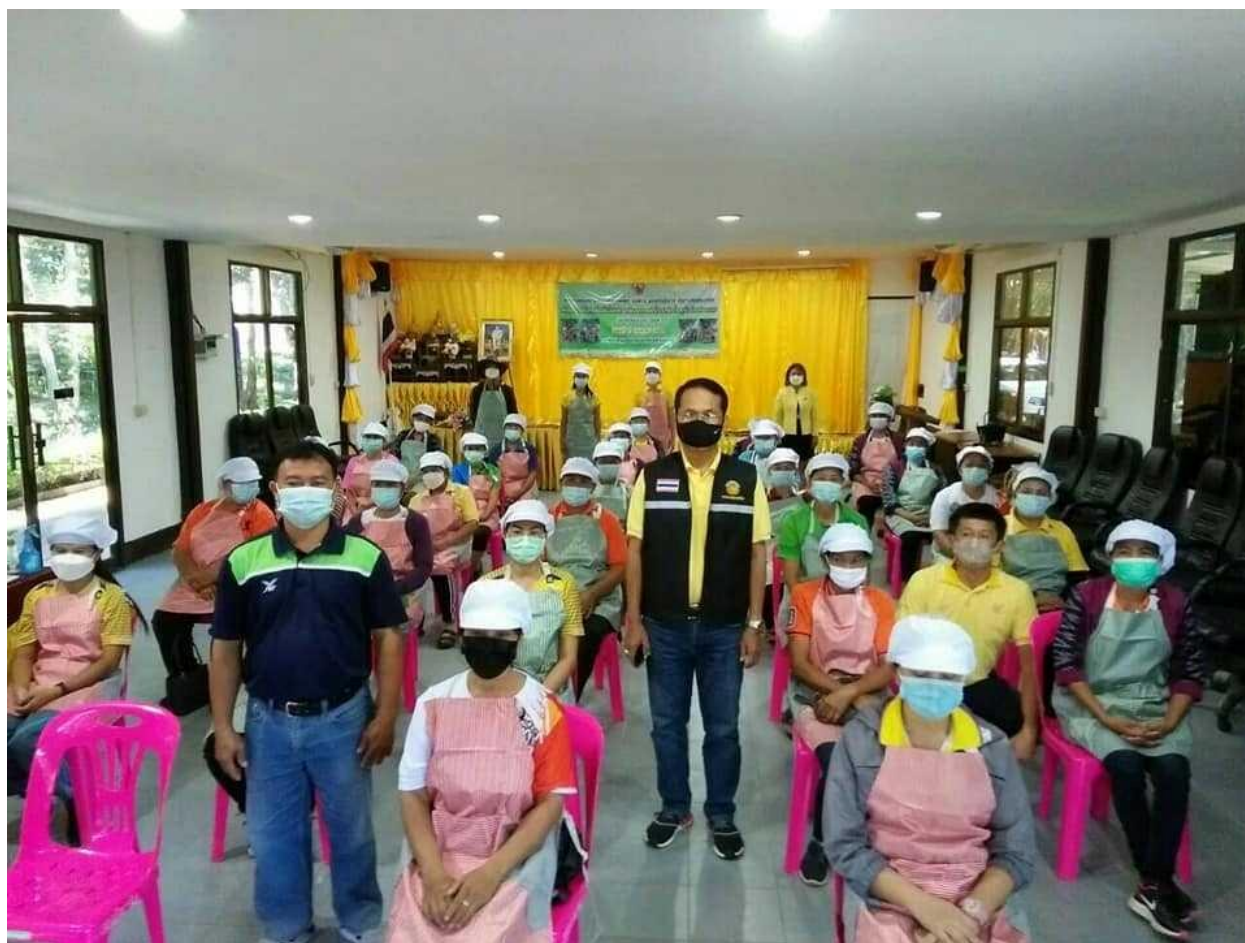
ภาพที่ 5.5 กิจกรรม/โครงการขององค์การบริหารส่วนตำบลบ้านจั่น อำเภอเมือง (4)

2) ควรศึกษาเปรียบเทียบ “ความพึงพอใจของผู้รับบริการขององค์การบริหารส่วนตำบล” หรือ “ความพึงพอใจของผู้รับบริการของเทศบาล” แต่ละแห่งในจังหวัดเดียวกัน หรือ เปรียบเทียบระหว่างภาค ตะวันออกเฉียงเหนือกับภาคอื่นๆ เช่น ภาคใต้ ภาคเหนือ ภาคกลาง เป็นต้น